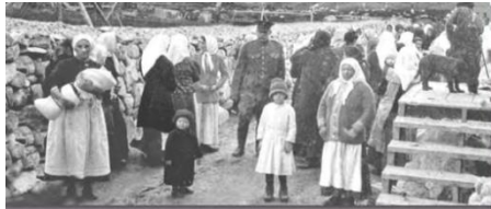
Първа национална кампания за интерниране в Канада, 1914-1920

Въпреки че никога не е имало двустранство за неволност от твоя страна, хиляди украинци и други европейци, включително българи, хървати, чехи, германци, унгарци, италианци, евреи, представени на различни вярности от Османската империя, поляци, румънци, сърби, словаци, словенци и други, са били затворени без нужда и принудени на тежка работа в 24 концлагера намерени си в пограничните периферии на страната по време на първата национална кампания за интерниране в Канада. Други десетки хиляди, определени като „араван-учуденици“ са били задържани да носят документи за самонадеяност и да се движат свободно в провинцията. Много са били подложени на други унижавящи мерки санкционирани от държавата, като изолация, ограничаване на свободата на излизане, движението и честността в колективни, депортиране и конфискации на каквато и малка собственост да са имали, част от които никога не са връщани. Това стана възможно, че британското външно министерство съобщава на Отава, че тези интернираните са „араван-учуденици“, които би трябвало да получат преференциално отношение. Тези мъже, жени и деца страдат не само от лишения, но и от самото изпитание на война, което ги откъсва от дома.