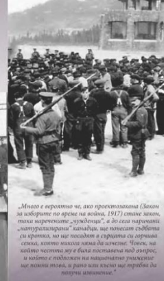
„Много е вероятно че, ако прожекционна (Закон за лаборатория по време на война, 1917) стана закон, така наречените „учуденици“, а до края на войната „интернализиран“ канадци, ще понесат свободата си временно, но ще попадат в сърцата си лични сметки, които никога няма да излезат. Човек, не който честна жена е била поставена под изпитание, и който е подложен на нечестивото изпитание ще получи това, и рано или късно ще трябва да получи изпитание.“