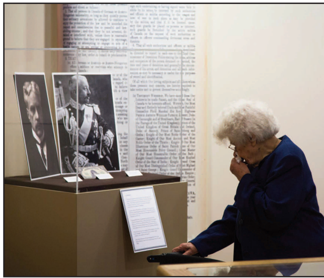
Са изложбе у Виндзору: Појресно сведочанство