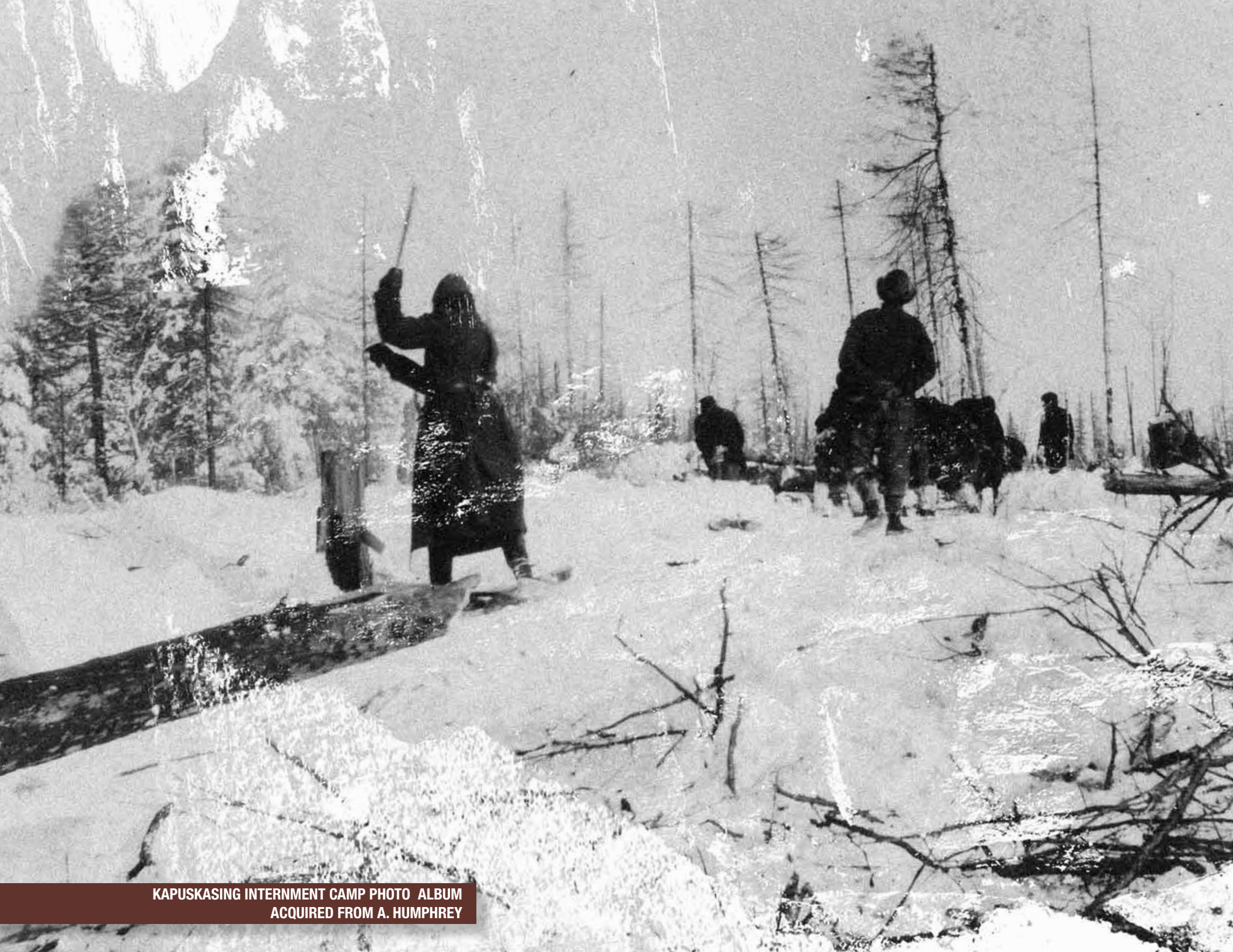
KAPUSKASING INTERNMENT CAMP PHOTO ALBUM ACQUIRED FROM A. HUMPHREY