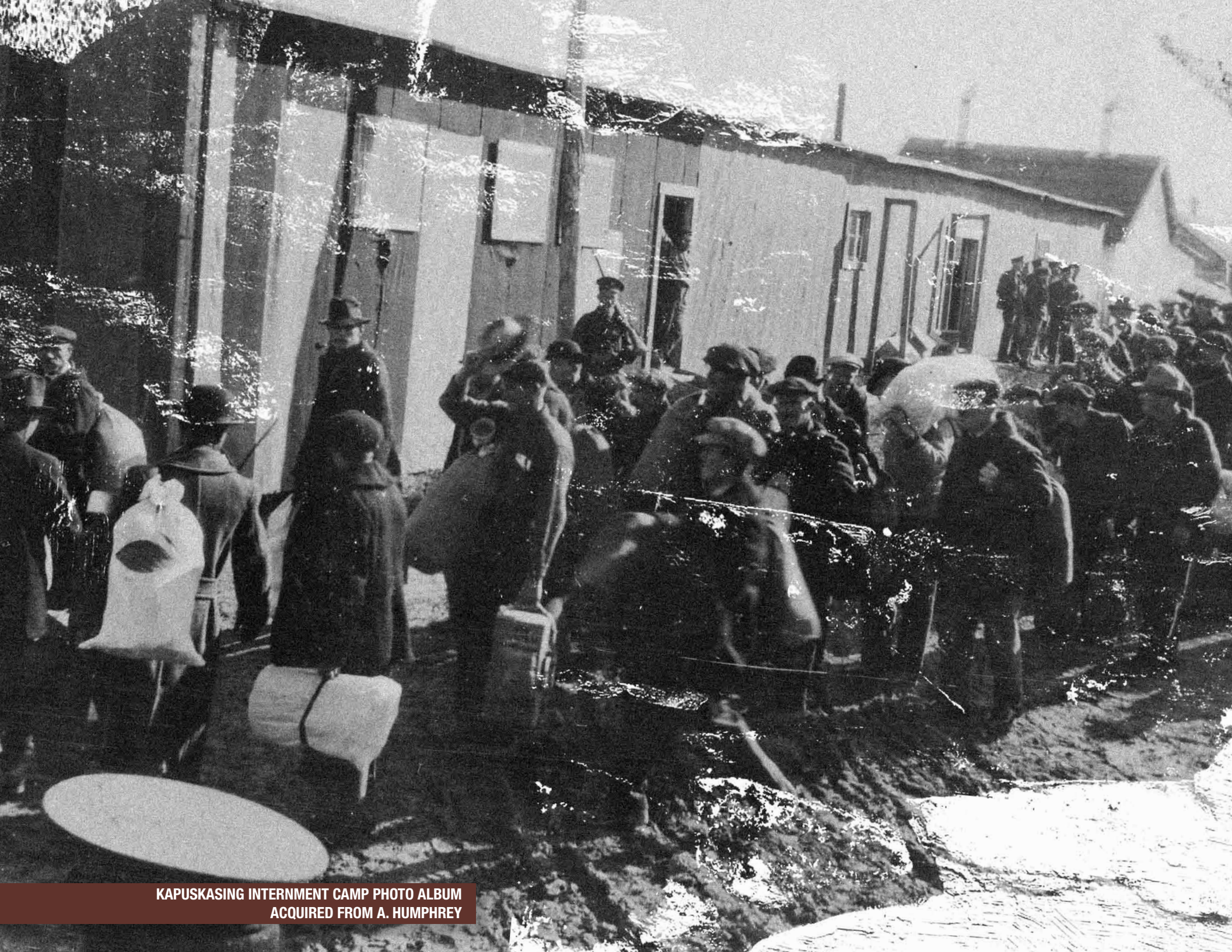
KAPUSKASING INTERNMENT CAMP PHOTO ALBUM ACQUIRED FROM A. HUMPHREY