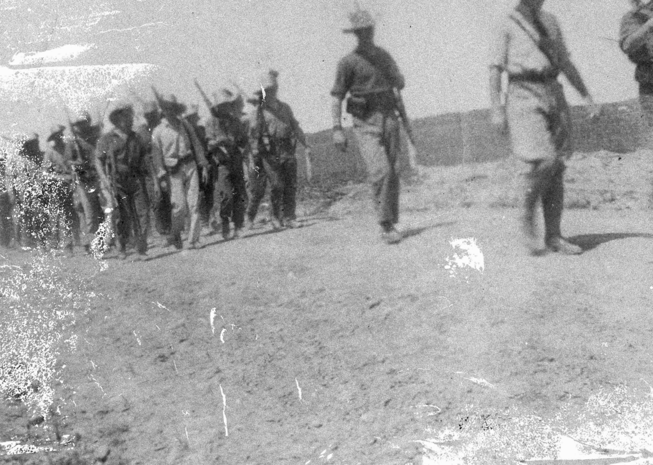
KAPUSKASING INTERNMENT CAMP PHOTO ALBUM ACQUIRED FROM A. HUMPHREY