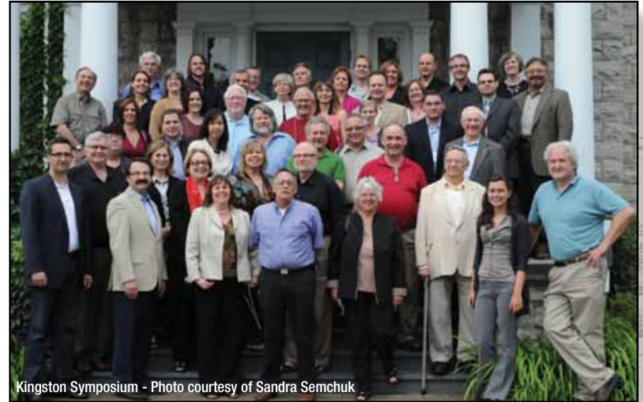
Kingston Symposium