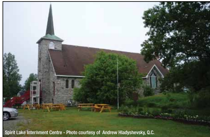
Spirit Lake Internment Centre

The Endowment Council has also made the restoration of internee cemeteries a priority to ensure that these ageing historical burial sites are preserved in perpetuity.