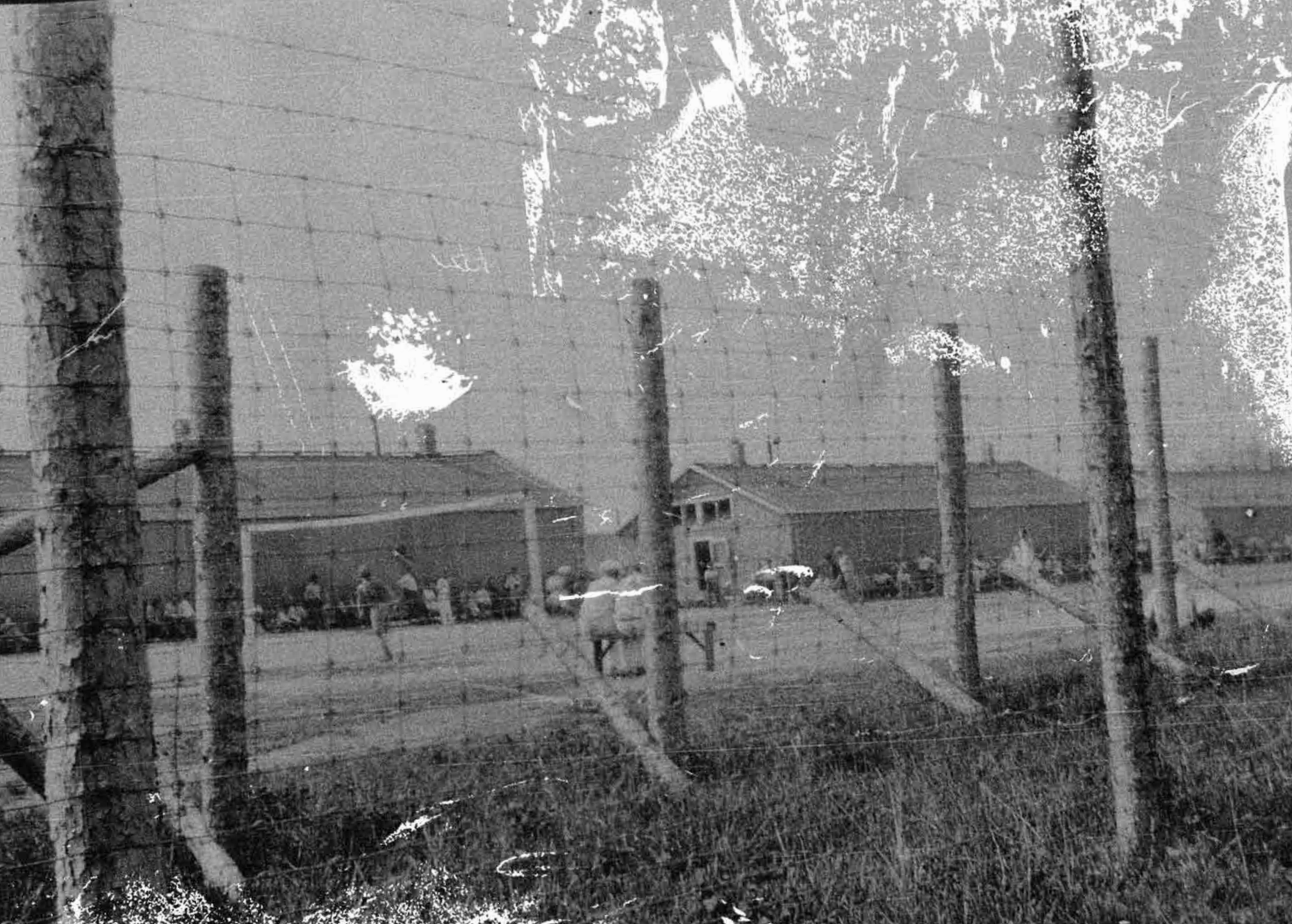
KAPUSKASING INTERNMENT CAMP PHOTO ALBUM ACQUIRED FROM A. HUMPHREY