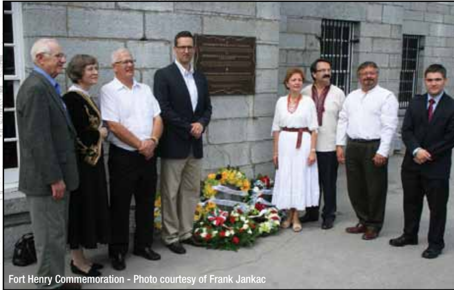
Fort Henry Commemoration