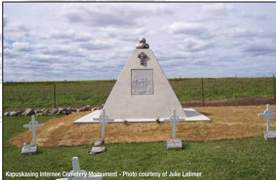
Kapuskasing Internee Cemetery Monument